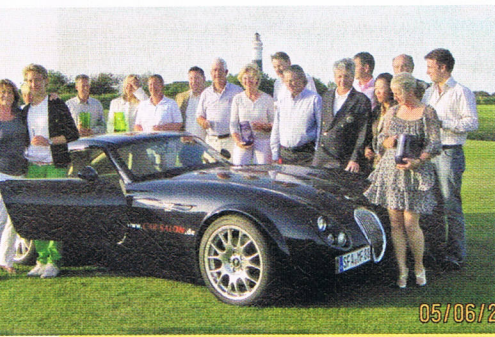
Die Sieger der Sylter Golf rallye.