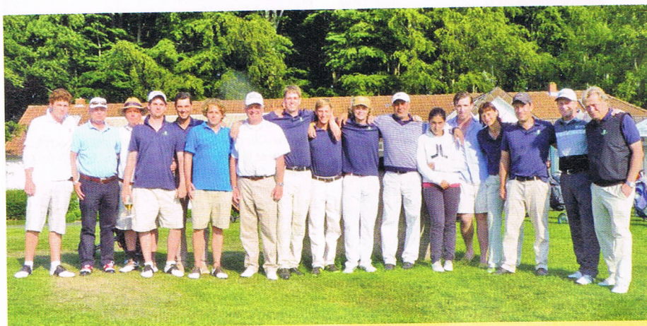
Die erfolgreiche Clubmannschaft mit Caddies und Kapitain.

Zum zweiten Mal wurde am 4. und 5. Juni die Sylter-Golfallye mit Hilfe der Sponsoren Auto Wiesmann und El Guana durchgeführt. Bei strahlendem Sonnenschein und sommerlichen Temperaturen kämpften 68 Teilnehmer