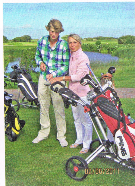
Bruttosieger unter sich (Himmelfahrt-Turnier).