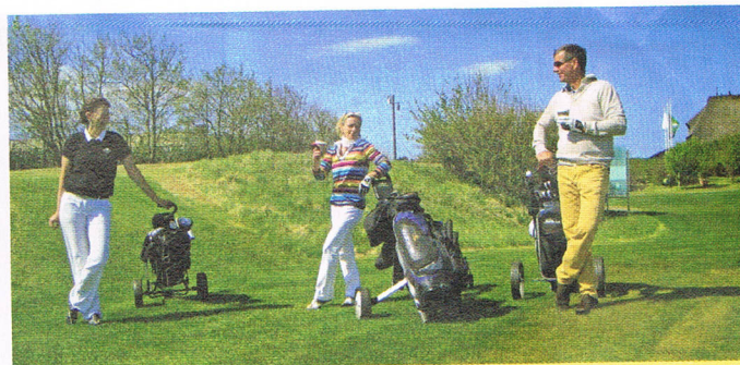
Golf, Kaffee, Sonne, gute Stimmung!

Ende und viele Gäste abgereist waren, fand sich ein Teilnehmerfeld von 27 Startern, für ein so frühes Zählspiel recht beachtlich. Die Mannschaftspokalspiele werfen eben ihre Schatten voraus. Viele unserer Stammspieler haben scheinbar auch ein gutes und erfolgreiches Trainingsprogramm trotz langem und ungemütlichem Winter hinter sich.