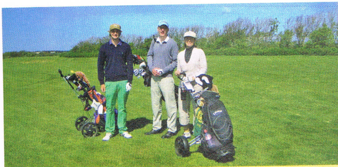
Der Flight der Bruttosieger Maiwettspiel.