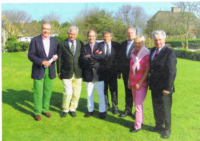
Das aktuelle Präsidium.

In der Woche zwischen Ostern und dem 1. Mai waren auch Dienstags-Damengolf und Mittwochs-Herregolf schon recht gut besetzt. Am 1. Mai wurde der 1. Monatspreis ausgetragen. Obwohl die Ferien schon zu