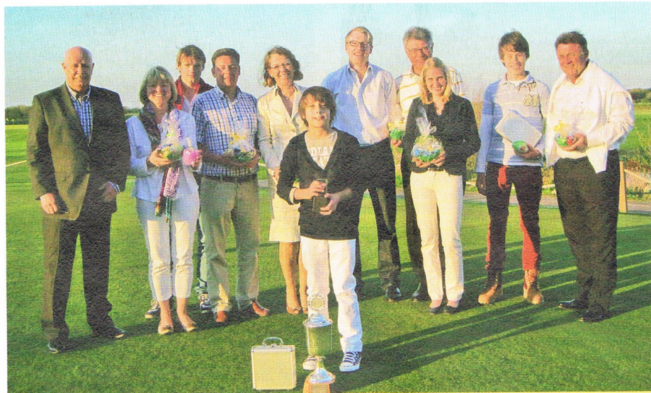
Sieger des Gründerpokals.

Die knapp hundert Mitglieder, die der Einladung des Präsidenten gefolgt waren, konnten erfahren, dass die Pläne zur Entzerrung des Championship-Kurses in Richtung Braderuper Heide weiter voranschreiten und insbesondere die Gemeinden Wenningstedt und Kampen den Golfclub hierbei unterstützen wollen. Die Erweiterung unseres wunderschönen Übungs- bzw. Kurzplatzes von sechs auf neun Löcher wird noch in diesem Sommer und die Vergrößerung der Terrasse bereits in den nächsten Wochen erfolgen. Also, für alle, die noch nicht auf der Insel sind: Es tut sich etwas! Der Jahresabschluss 2010 und auch der Etat 2011 gaben keine wesentlichen Diskussionen, und so konnte erwartungsgemäß das Präsidium für die hervorragende Arbeit